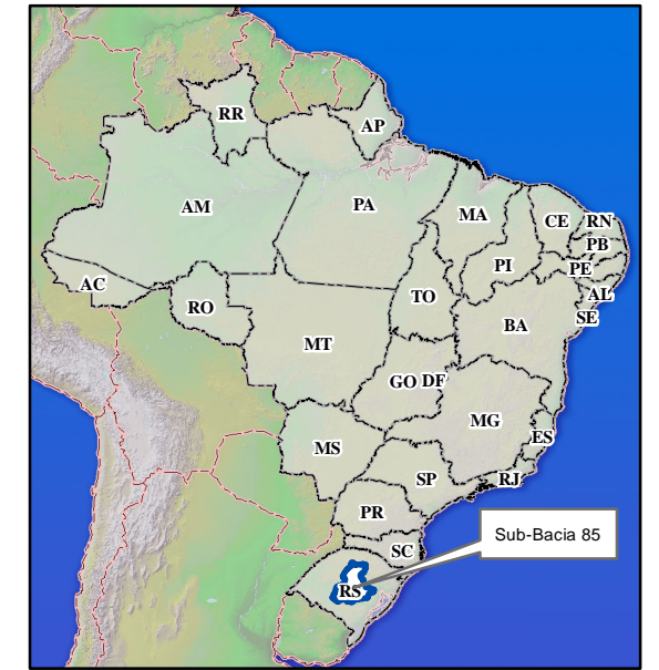
Mapa de Situação