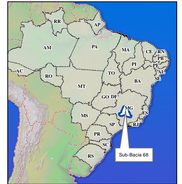
Mapa de Situação