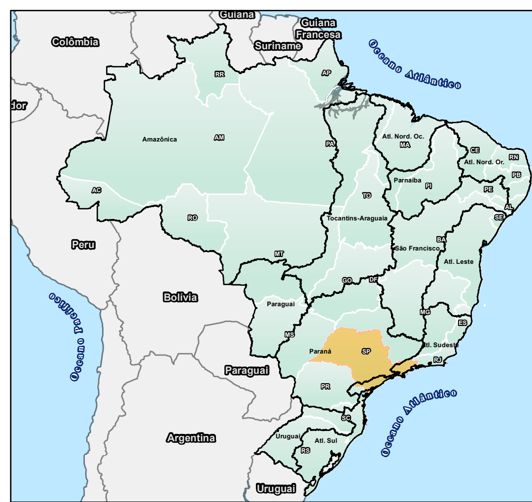
MAPA DE LOCALIZAÇÃO - ESTADO