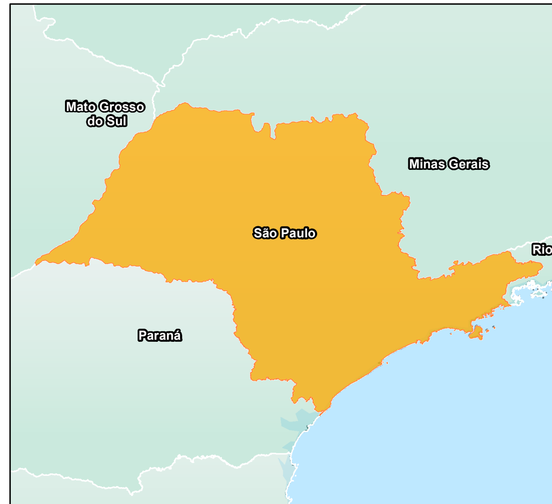
ESTADO DE SÃO PAULO Convenções Cartográficas