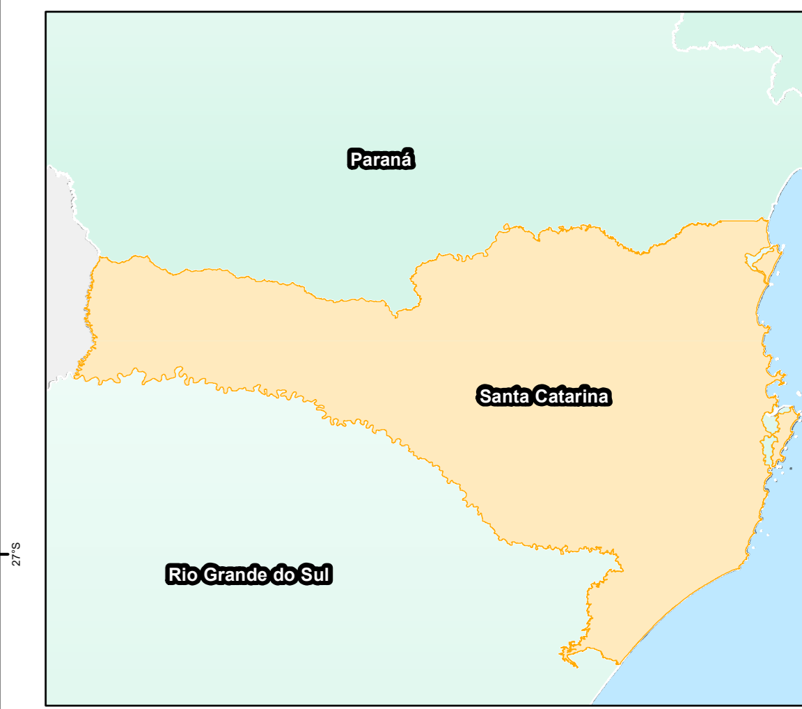
ESTADO DE SANTA CATARINA Convenções Cartográficas