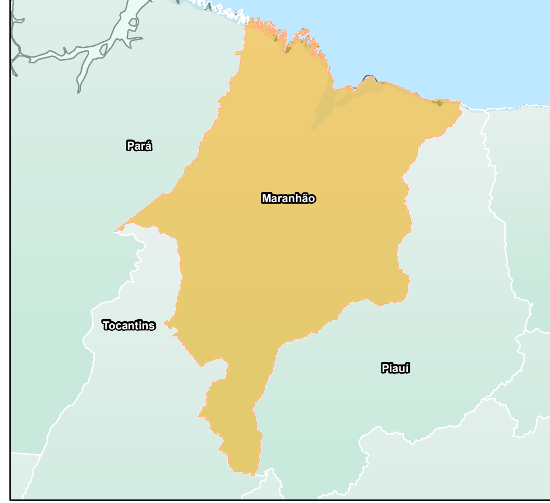
ESTADO DO MARANHÃO Convenções Cartográficas