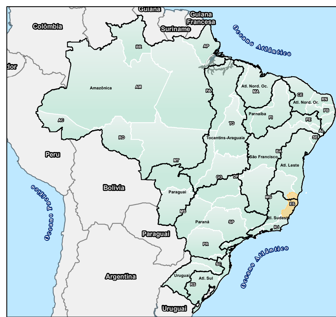
MAPA DE LOCALIZAÇÃO - ESTADO