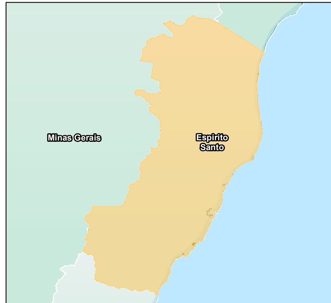
ESTADO DO ESPÍRITO SANTO Convenções Cartográficas