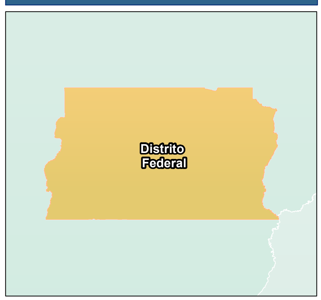
ESTADO DISTRITO FEDERAL Convenções Cartográficas