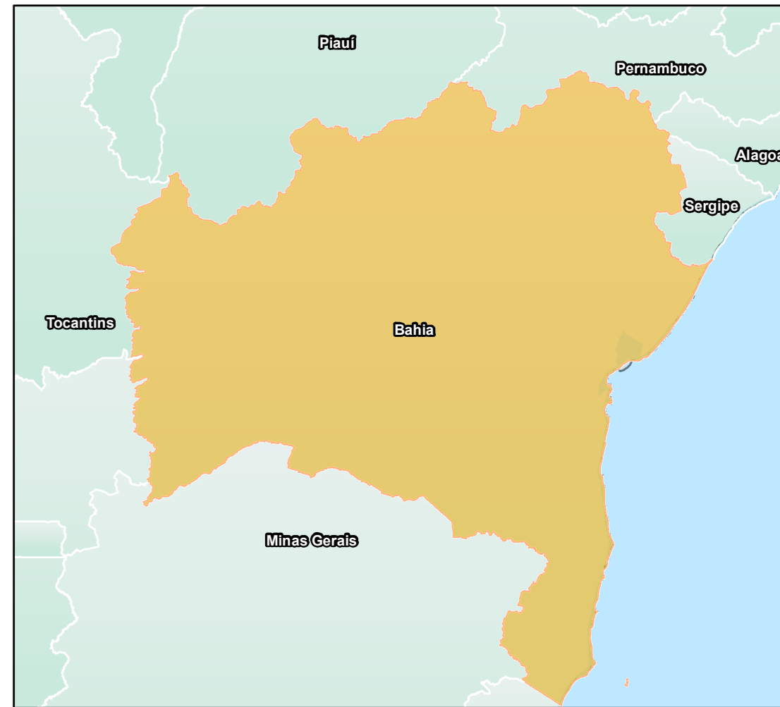
ESTADO DA BAHIA Convenções Cartográficas