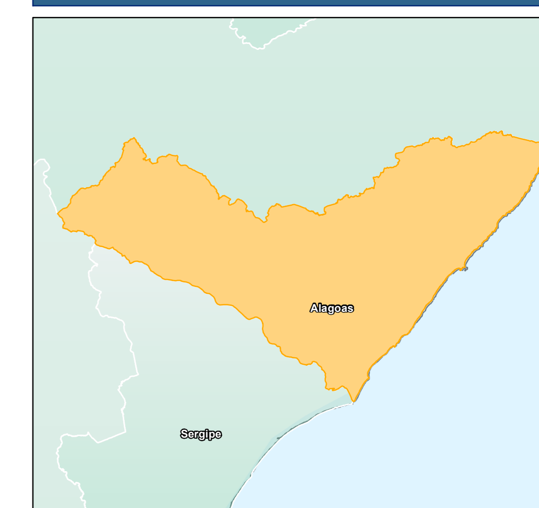
ESTADO DE ALAGOAS Convenções Cartográficas